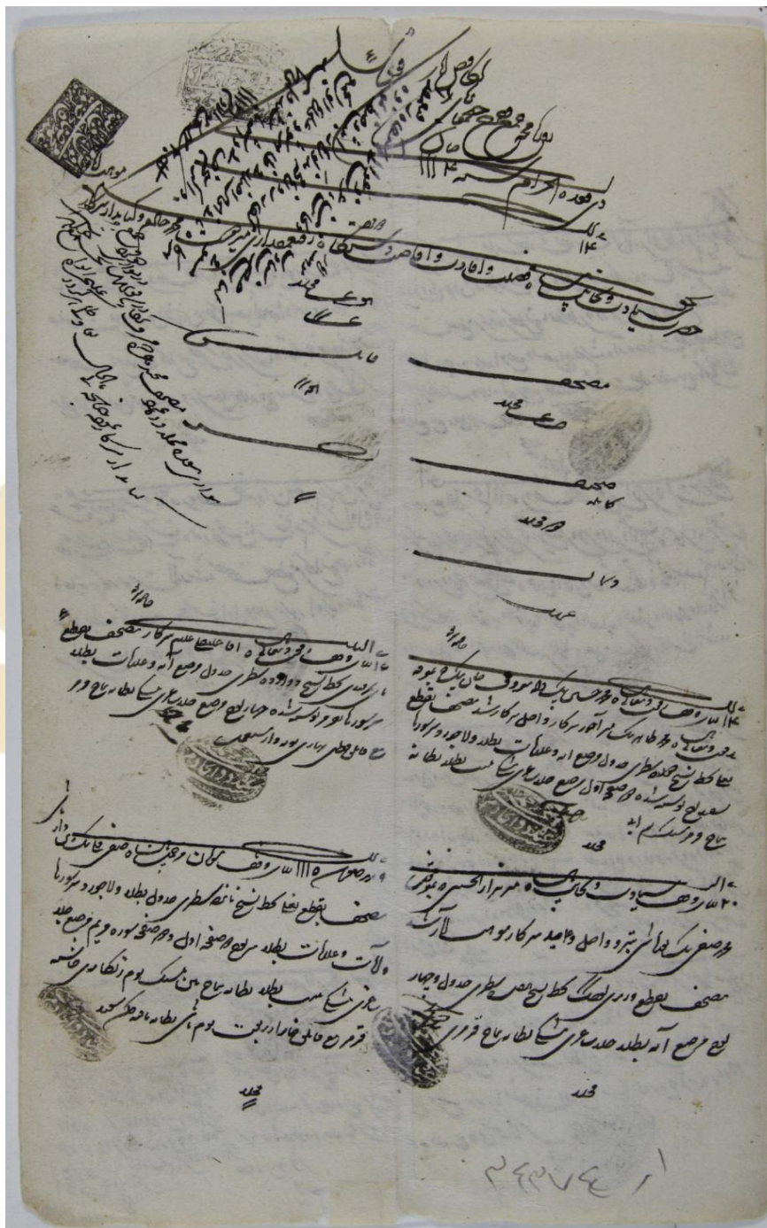
فهرست کتب وقفی در دوره صفویه