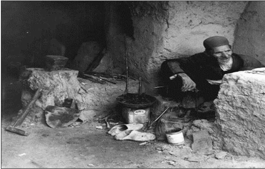
تصویر شماره سه: نمایی از کارگاه آهنگری در طبس

محمد صانع عکاس: عکاس محل: طبس تاریخ عکس: ۱۳۵۴