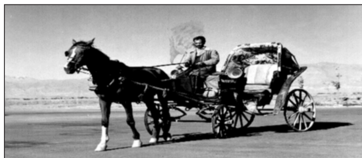
تصویر شماره شش: تصویری از یک درشکه‌چی در مشهد