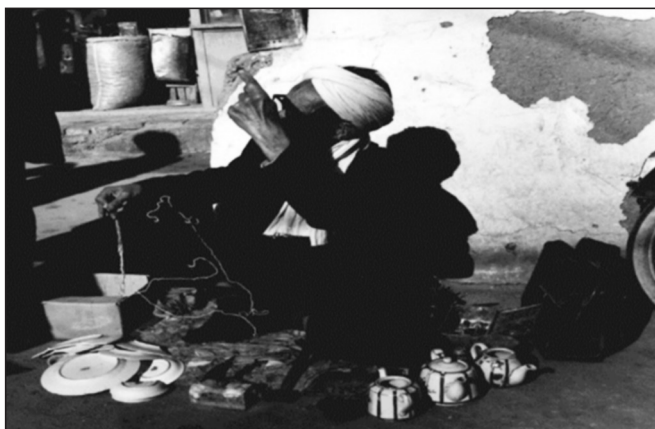
تصویر شماره پنج: نمایی از مرد چینی بند زن در طبس

از این لحظه به بعد چنانچه ظرف چینی خانواده‌ای می‌شکست بایستی تا دفعه بعد تکه‌های شکسته را برای ترمیم نگه می‌داشتند و از استفاده آن محروم بودند. نسل‌های قبل بخوبی این خاطره‌ها را بیاد دارند. این شغل نیز همچون شغل‌های دیگر به دلیل مهاجرت و نیز پیشرفت کمی و کیفی وسایل و عدم نیاز به ترمیم مجدد آن متاسفانه از فهرست مشاغل حذف شده است.