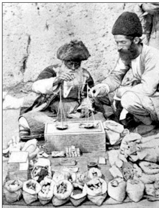
تصویر شماره هشت: تصویری از یک دکان داروفروشی

رنگ، بو، طعم، آمیختگی های درون یک چهار دیواری به نام عطاری، عطاری های سنتی و قدیمی در واقع، داروخانه ها، دکترها و یا حکیمان دیروزها بوده اند. کنار مطب پزشکان، طب سنتی جایی برای خود باز کرد و معجزه گل ها و گیاهان شفابخش خود را به نمایش گذاشت، با ازدیاد مطب پزشکان رفته رفته کار و بار عطار طبیبان قدیمی هم کمتر شد و هم از رنگ و روی گذشته شکل تازه تری یافت آن دسته از عطار طبیبان ریشه دارتر که با طب امام جعفر صادق و طب الرضا علیهم السلام یا طب ابو علی سینا تحفه حکیم مؤمن و قربادین کبیر آشنا بودند همچنان ماندند.