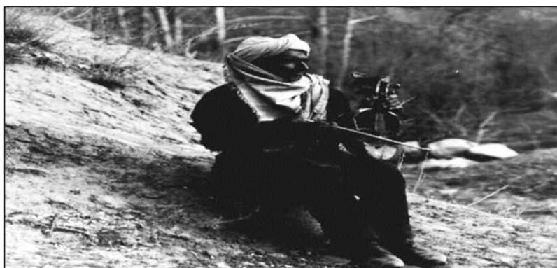
تصویر شماره چهار: نمایی از مرد کمانچه زن