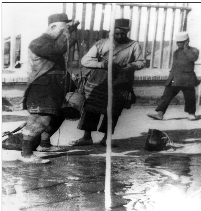
تصویر شماره ده: توزیع آب در اوایل دوره پهلوی

تعیین بزرگترین روز سال، طولانی‌ترین شب و روز و تعیین اوقات شرعی در دوره اسلامی بکار برده می‌شد.