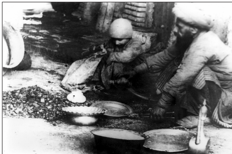
تصویر شماره یازده: شغل مسگری از مشاغل قدیم

انواع ظروف، وسایل و اشیاء مسین می ساختند. امروزه در این بازارها هنوز آثاری از این هنر یافت می شود. کشف دو کوره ذوب فلز در محوطه سه هزار ساله «اسپیدژ» در سیستان و بلوچستان نشان داد که مردم اسپیدژ، پیش از تاریخ به هنر مسگری و فلزکاری مسلط بوده اند.