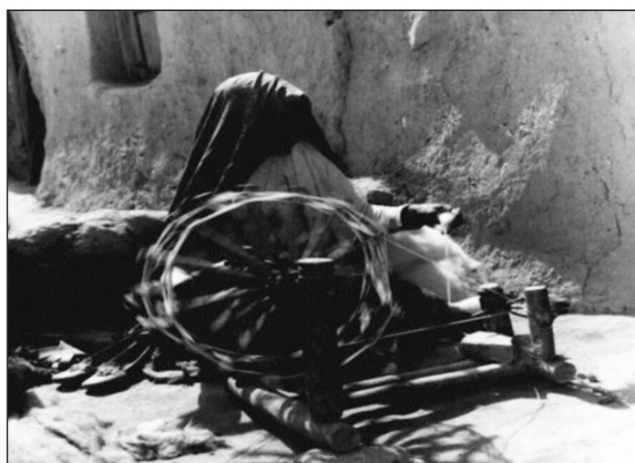
تصویر شماره هفت: نمایی از یک زن چرخ ریس

تبدیل الیاف به نخ، ریسندگی نامیده می‌شود. انسان از هزاران سال پیش به این موضوع پی برده بود که اگر دسته‌ای از الیاف را با کشش دادن، موازی کرده و آن را تاب دهد فشار و اصطکاک سطحی بوجود آمده بین الیاف، باعث درگیری آنها به یکدیگر شده و رشته‌ای مقاوم‌تر را تشکیل می‌دهند که همان نخ است. این عمل اساس تبدیل الیاف به نخ است که ریسندگی نامیده می‌شود. ریسندگی بر سه اصل استوار است.