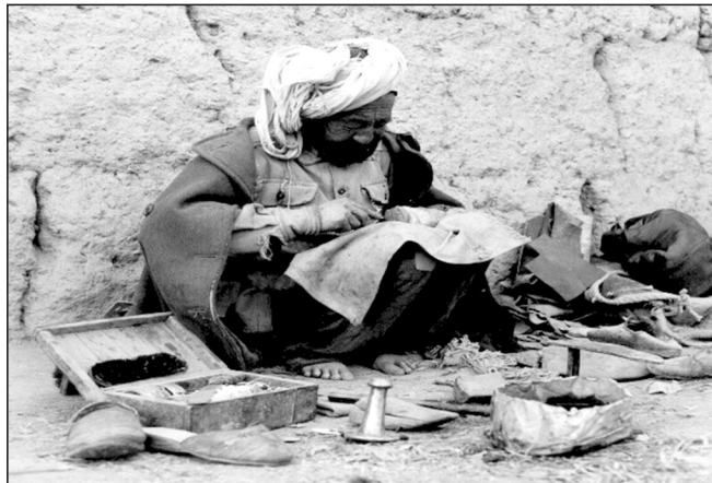
تصویر شماره یک: نمایی از یک مرد پینه‌دوز

از مشاغل سنتی، عمل تعمیر کردن کفش و گیوه پاره و خراب. پینه‌دوزان اغلب به صورت سیار کار می‌کردند، مگر شماری اندک که در دکان‌هایی کوچک مشغول به کار بودند. ابزار کار دکان‌دارهای این جماعت عبارت بود از چهارپایه‌ای کوتاه برای نشستن، میزی کوچک برای کار، تغاری آب، درفش و سوزن و نخ، چکش و سندانی کوچک، گزن و سریش.