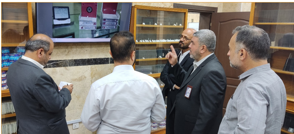
تصویر ۱- بازدید از مرکز تصویر برداری و فهرست نسخ خطی (۱۴۰۲/۴/۱۶)