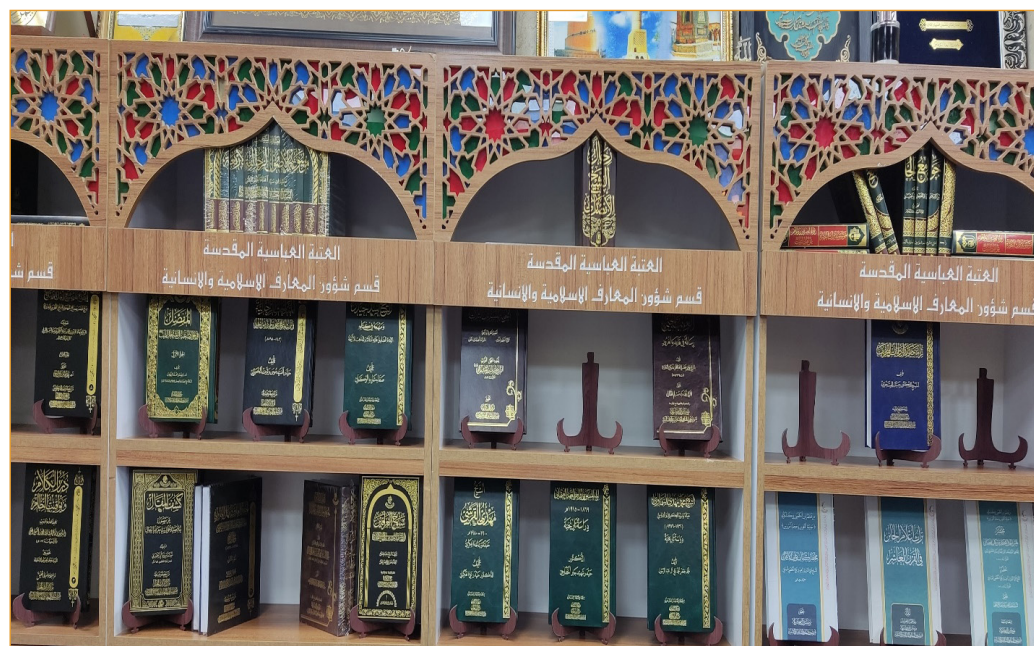
تصویر ۷- بازدید از بخش معارف انسانی و اسلامی