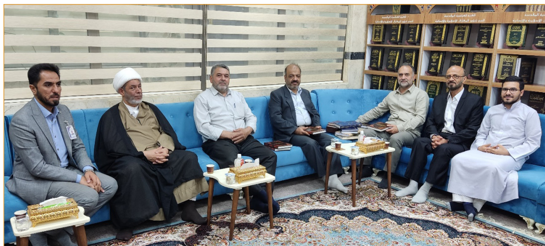
تصویر ۶- بازدید از بخش معارف انسانی و اسلامی

جنوب و شعبه مشهد و قم قرار دارد. این مراکز به غیر از مشهد از کارکرد یکسانی برخوردارند و در زمینه شناسایی میراث خطی، اسنادی و تاریخ شفاهی و احیای نسخ خطی کار می‌کنند. تأکید آن‌ها علاوه بر نسخ خطی در زمینه تاریخ محلی است. هر کدام از مراکز میراث دارای قسمتهای شناسایی، جمع‌آوری، تحقیق و پژوهش و انتشارات بوده و تا کنون ۳۵۰ عنوان کتاب چاپ نموده‌اند. علاوه بر آن مراکز میراثی مجله‌ای را مانند مجله تراث کربلا و یا مجله تراث حله منتشر می‌نمایند.