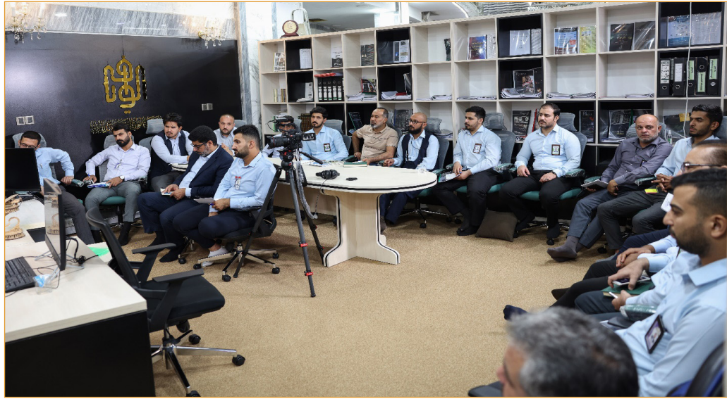
تصویر ۱۴- برگزاری کارگاه تاریخ شفاهی در زمینه نحوه مستندسازی تاریخ جنگ در محل مؤسسه الوافی در کربلا (۱۴۰۲/۴/۲۱)

در این مأموریت از موزه حضرت ابوالفضل (ع) و خزانه آن، کتابخانه آیت الله خویی و موزه آن و کتابخانه تازه تأسیس ساخته شده توسط ایران در نجف نیز بازدید شد که به دلیل تمرکز این گزارش بر فعالیت‌های میراث خطی عتبه آورده نشد.