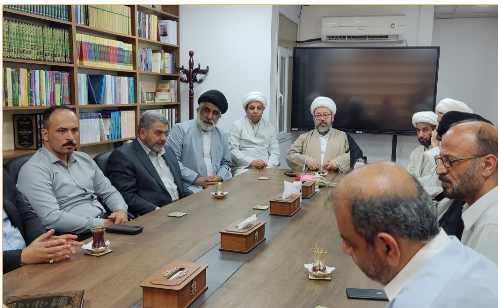
تصویر ۱۲- بازدید از مرکز صادقین و جلسه مشترک با رئیس و پژوهشگران مرکز صادقین و شیخ طوسی در نجف (۱۴۰۲/۴/۱۹)