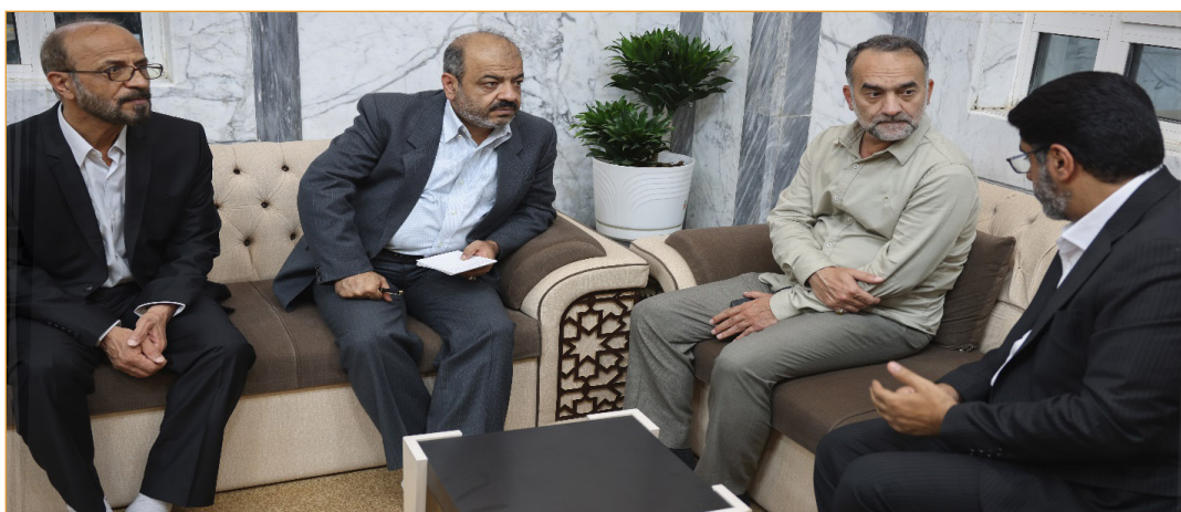
تصویر ۱۳- بازدید از مؤسسه الوافی در کربلا در ۱۴۰۲/۴/۱۶

این مرکز به منظور مستندسازی تاریخ نهضت مردم عراق علیه صدام و شهدای نبرد با حشد الشعبی زیر نظر مستقیم تولیت از سال ۲۰۱۶ تشکیل شده است. تا کنون هزار ساعت مصاحبه تصویری را انجام داده است. مهمترین دستاورد مرکز چاپ موسوعه فتوی الدفاع الکفایی در ۸۰ جلد است این مجموعه ۱۰۰۰ ساعت مصاحبه و مستندسازی انجام شده است. با توجه به تجربیات اینجانب در زمینه تاریخ شفاهی دفاع مقدس در حین بازدید مواردی تذکر داده شد و اولین کارگاه تاریخ شفاهی در زمینه مستندسازی تاریخ جنگ برگزار شد.