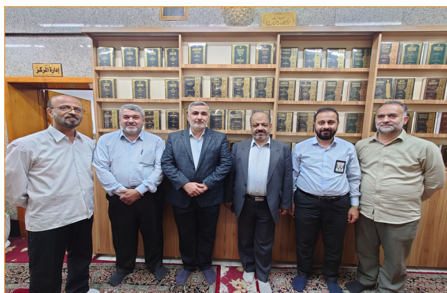
تصویر ۹- بازدید و جلسه در محل هئیت عالی تراث و مرکز احیا تراث عام در کربلا (۱۴۰۲/۴/۲۰)

مرکز احیاء عام تراث: این مرکز دارای ۲۷ نفر نیرو است و به صورت عمومی از سال ۱۳۸۷ در زمینه احیا میراث تشیع مشغول به کار هستند. این مرکز از چهار بخش تصحیح نسخ خطی، آماده‌سازی و حروفچینی، بخش بررسی زبانی و بخش انتشارات تشکیل شده است. از مهمترین فعالیت‌ها می‌توان به نرم‌افزاری کردن کتاب طبقات اعلام الشیعه، تهیه دانشنامه اردوبادی، جمع‌آوری کتاب مدینه العلم شیخ صدوق، تأکید بر مستندسازی رجال شیعه و بازنشر مجدد مقالات مهم در مجله لغة العرب اشاره نمود. مجلة الخزانة در زمینه اسناد و نسخ خطی نیز در این بخش منتشر می‌گردد.