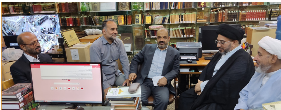
تصویر ۵- بازدید از مرکز مرمت نسخ خطی دارالمخطوطات