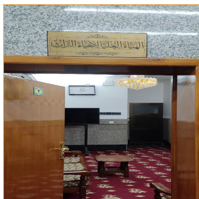
تصویره ۱- مرکز احیا تراث عام در کربلا.