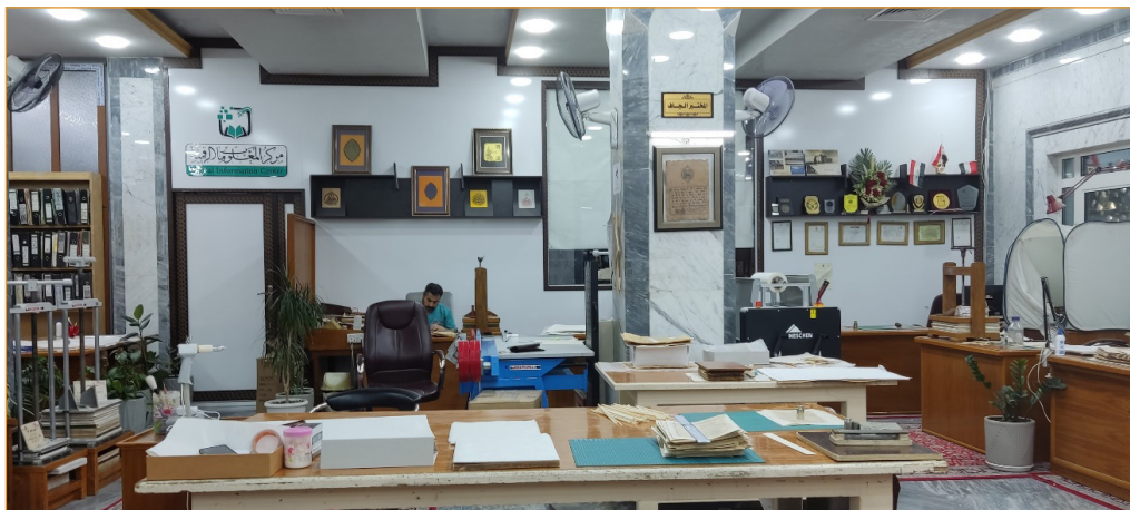
تصویر ۴- بازدید از مرکز مرمت نسخ خطی دارالمخطوطات