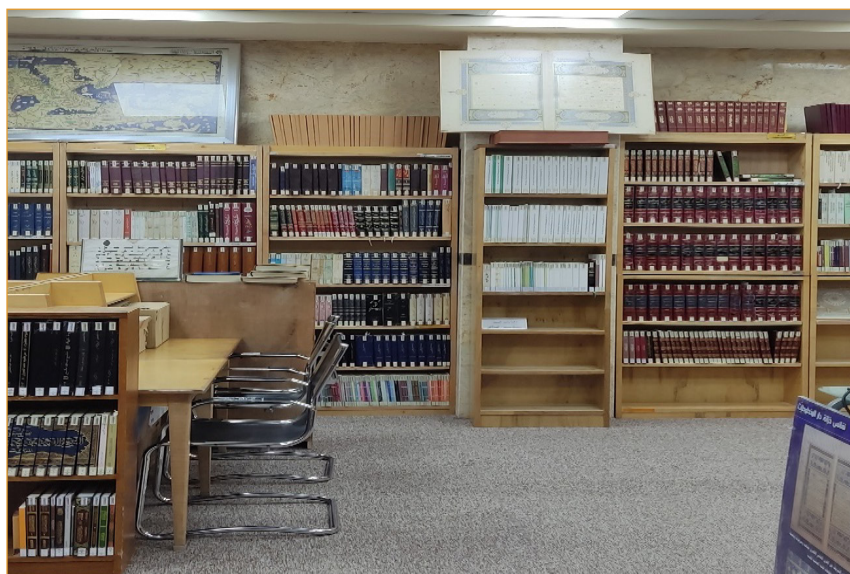
تصویر ۲- کتابخانه تخصصی فهرست‌های نسخ خطی (۱۴۰۲/۴/۱۶)